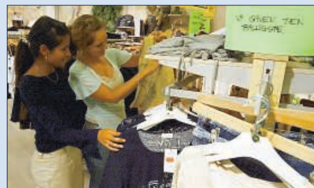
En regnfuld sommer og skattelettelse har sat skub i forbruget og det kan for alvor mærkes i storcentrene.