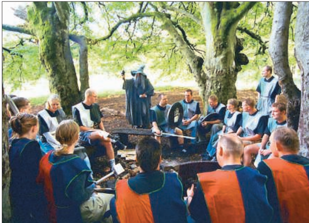
Iført papsværd og ridderdragt har en gruppe medarbejdere erstattet hverdagen i en virksomhed med et magisk univers af onde trolde og forheksede slotte.